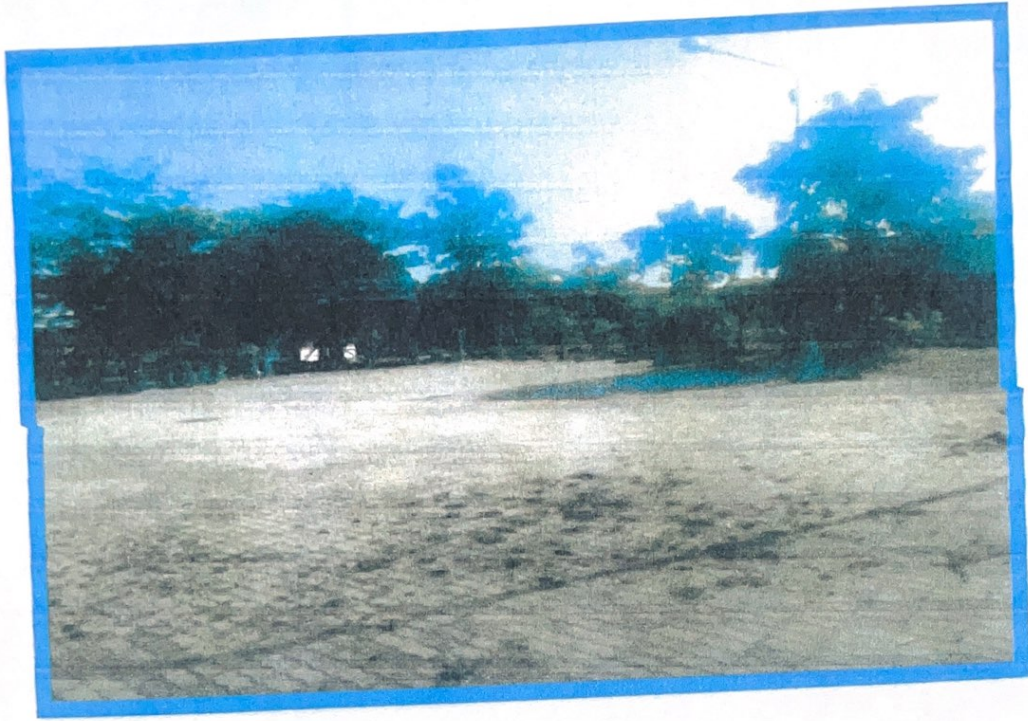
บ้านหลุมไผ่ หมู่ที่ ๖ บ้านหนองหว้าหมู่ที่ ๙