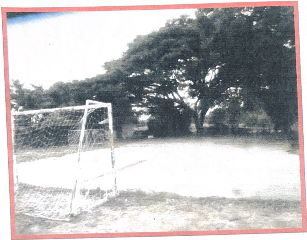
สนามกีฬาบ้านหนองบากหมู่ที่ ๗