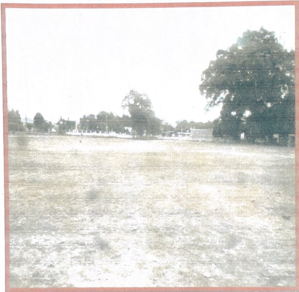
สนามกีฬาบ้านท่าโพธิ์ หมู่ที่ ๒