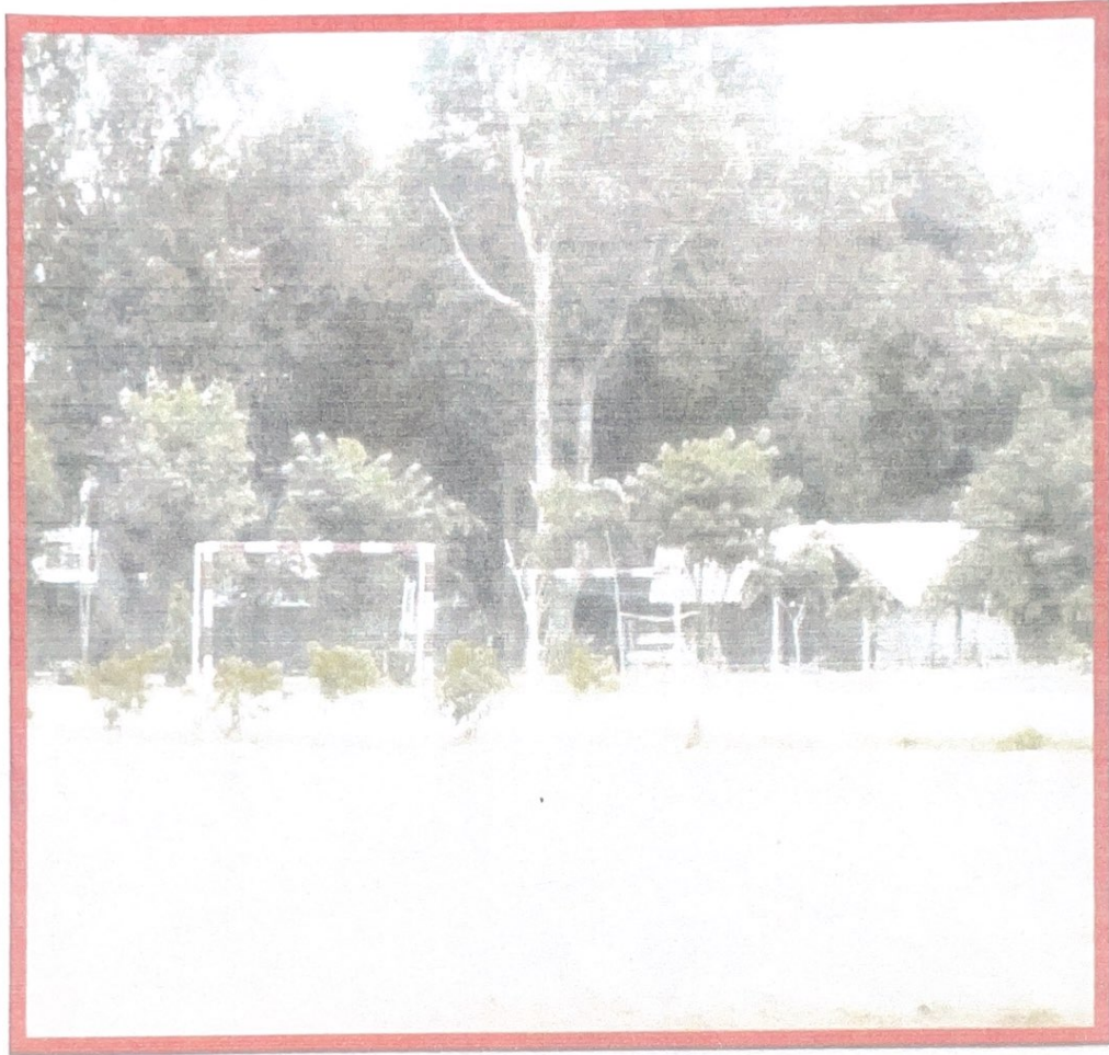
สนามกีฬาบ้านร่องอโคก หมู่ที่ ๑๕