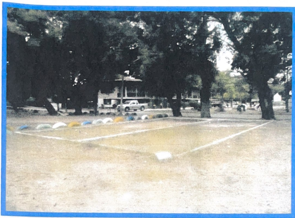
บ้านหนองหัวลิงหมู่ที่ ๑๒ บ้านร่องอโคกหมู่ที่ ๑๓